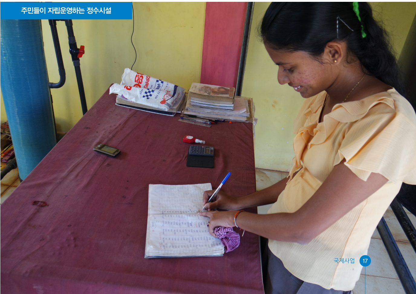
주민들이 자립운영하는 정수시설