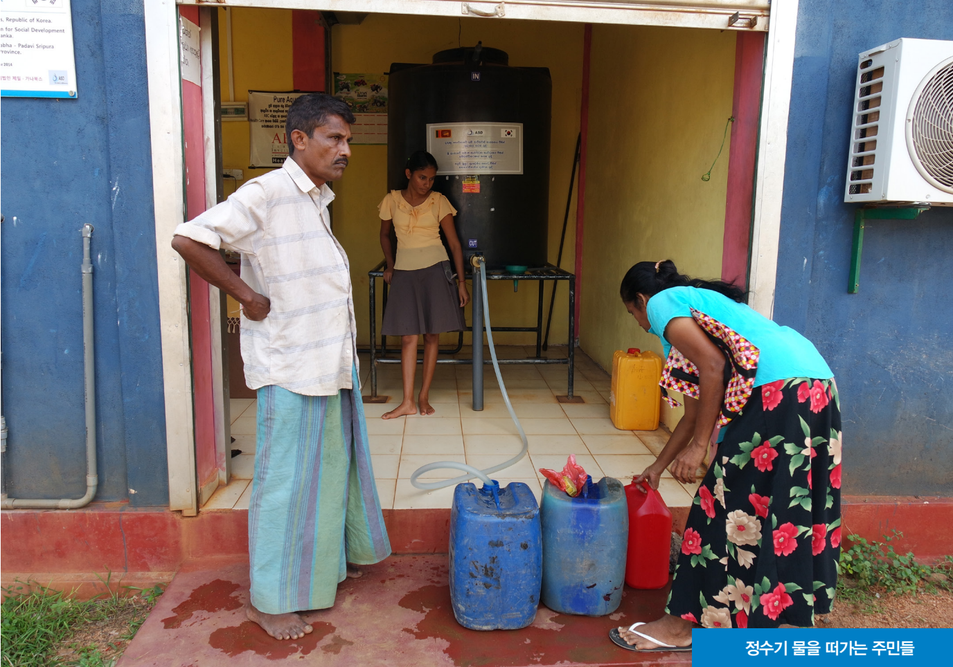
정수기 물을 떠가는 주민들